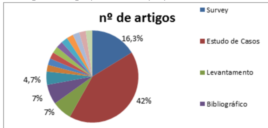
Figura 4 – Porcentagem de artigos por método de pesquisa

Quanto ao método de pesquisa, houve o mesmo problema citado acima, pois, a maior parte dos autores não deixou explícito o método adotado, cabendo aos autores classificarem os demais. Foram encontrados como métodos utilizados: bibliográfico, bibliométrico, comparativo, ensaio teórico, estudo de caso, design Research , levantamento, survey , entre outros, conforme exposto na figura 6, onde pode-se observar a porcentagem de artigos por método identificado. Destaca-se que algumas classificações de métodos são, na verdade, técnicas de coleta de dados, como as entrevistas.