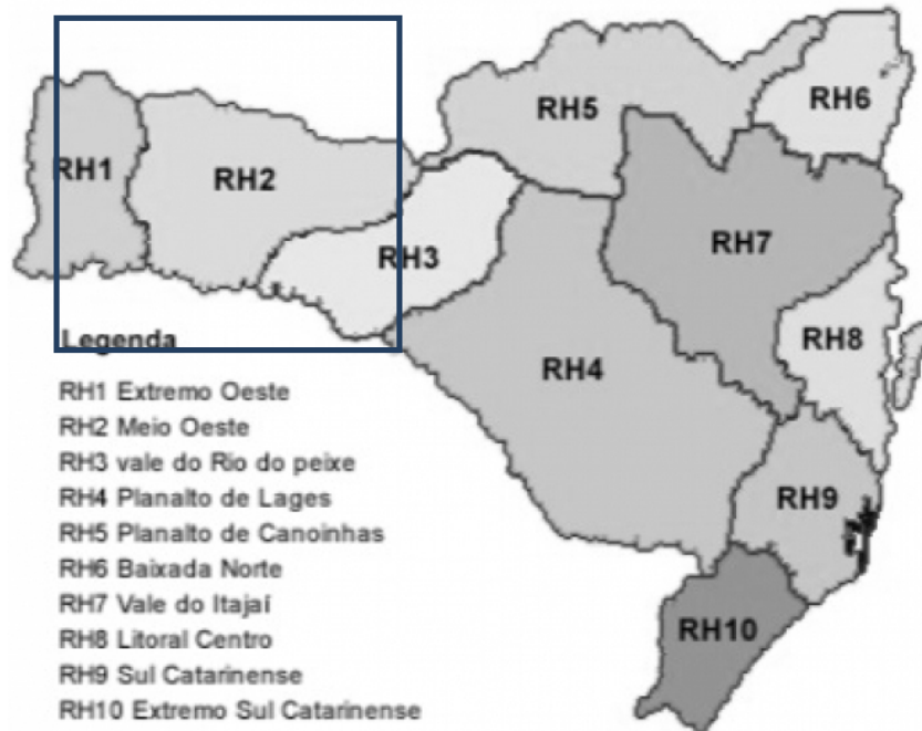
Figura 1. Regiões Hidrográficas de Santa Catarina

Estas entidades foram selecionadas através de análise levando em consideração: a) Área de abrangência da Entidade; b) Atividades ligadas diretamente ao uso de recursos hídricos; c) Participação no Comitê de Bacias; d) Conhecimento do entrevistado em relação à Bacia Hidrográfica; e) Histórico de dados da Entidade.