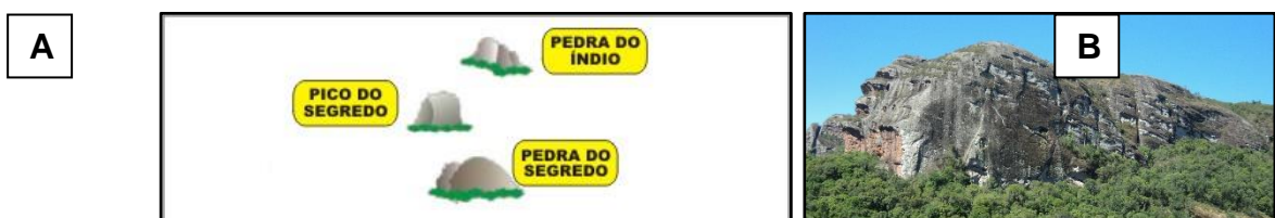
Figura 1 – principais formações rochosas de Caçapava do Sul.

Os processos naturais à que este território foi submetido ao longo da história da Terra, produziram um patrimônio natural de reconhecida importância científica e beleza cênica, a exemplo das Guaritas e da Serra do Segredo (figura 1).