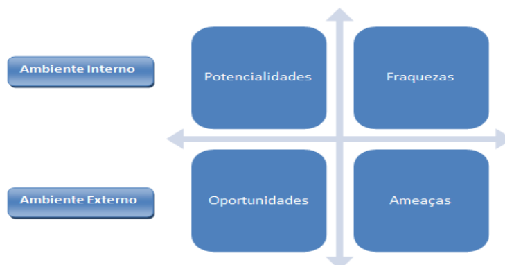
Figura 2: Matriz SWOT

Na concepção de Ibanez, Aldana e Ruiz (2008), a matriz SWOT é uma estrutura conceituada para a análise sistemática que facilita a comparação das ameaças e oportunidades com as forças e fraquezas da organização. Seu uso apropriado provê uma boa base para a formulação de estratégias.