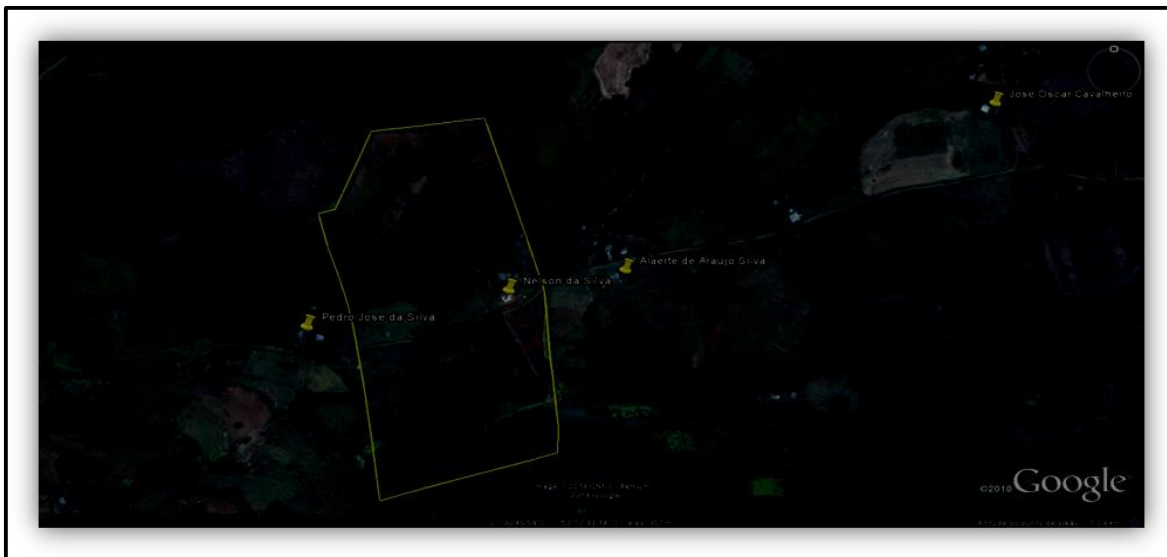
Figura 2 - Croqui da propriedade rural objeto do estudo

A propriedade possui produção de produtos hortifrutigranjeiros, baseado na produção de mandioca e fruticultura, possui açudes e área de reserva florestal nos 12,5 hectares de terra.