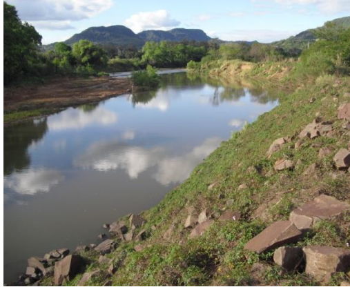
Figura 01: margem direita do Rio Soturno, São João do Polêsine.