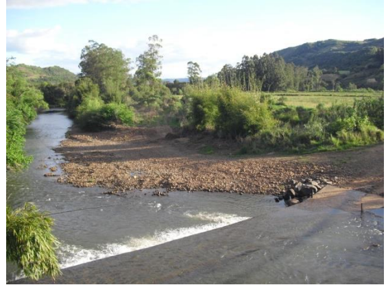
Figura 02: área erodida na divisa entre Faxinal do Soturno e Nova Palma. Ao fundo, lavoura de arroz na qual se utiliza herbicidas e outros defensivos agrícolas.