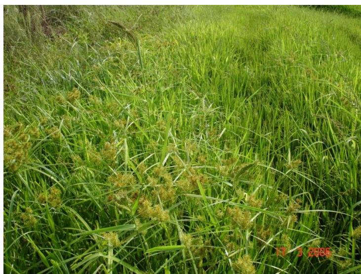
Fig. 4. Área com alta infestação de junquinho ( Cyperus sp. ).

A Figura 4 mostra uma área altamente infestada por ciperáceas onde se observa que as maiores densidades se encontram nas taipas, corroborando com o fato de que a água de irrigação possui ação direta na reinfestação da área.