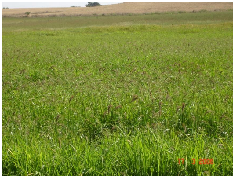
Fig. 3. Lavoura de arroz com alta infestação de capim arroz ( Echinochloa sp. ) devido ao atraso na entrada de água e desuniformidade da lâmina.

Erasmio et al. (2003), estudando a densidade e o período de convivência das plantas de junquinho ( Cyperus esculentus ) no arroz irrigado, observou que o perfilhamento foi afetado desde o 15º DAE e o rendimento da cultura sofreu uma redução de 20,1%, acentuando-se a partir dos 35 dias de convivência com a invasora.