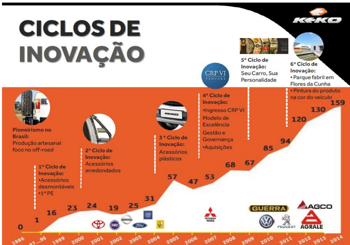
Figura 3: Ciclos da Inovação Keko

Mais de 40% do faturamento atual vem de produtos lançados nos últimos 24 meses, afirma o Presidente Executivo da Keko, por isso a importância da inovação constante. A empresa busca constantemente a renovação dos acessórios que fabrica. A exportação responde por 19% dos negócios, com produtos comercializados com Alemanha, Austrália, Turquia e Tailândia, entre outros.