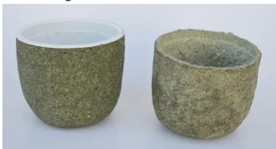
Tingimento com erva-mate.