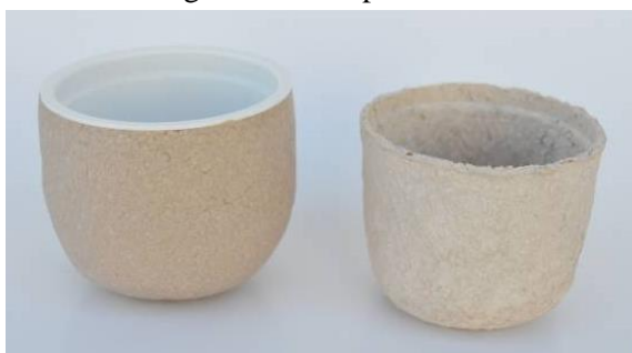
Tingimento com casca de cebola.