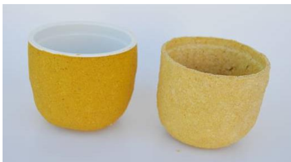
Tingimento com açafrão.

Entre os corantes, a beterraba e o colorau foram os que apresentaram maior contraste da água tingida com o aspecto final; a cor rosada e avermelhada, respectivamente, perderam-se totalmente. As imagens seguintes ilustram o contraste da massa de papel machê molhada (pote da esquerda) ao lado da seca (pote da direita).