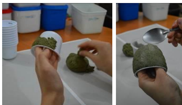
Figura 9 – Modelagem em pote.

Obtendo-se uma massa homogênea, é possível iniciar a modelagem na forma. O processo consiste em espalhar a massa na superfície da forma, atentando-se para que não haja nenhum espaço sem preenchimento. Para conferir o aspecto liso, utilizou-se uma colher e adicionou-se um pouco de grude para facilitar o espalhar da massa (Figura 8).