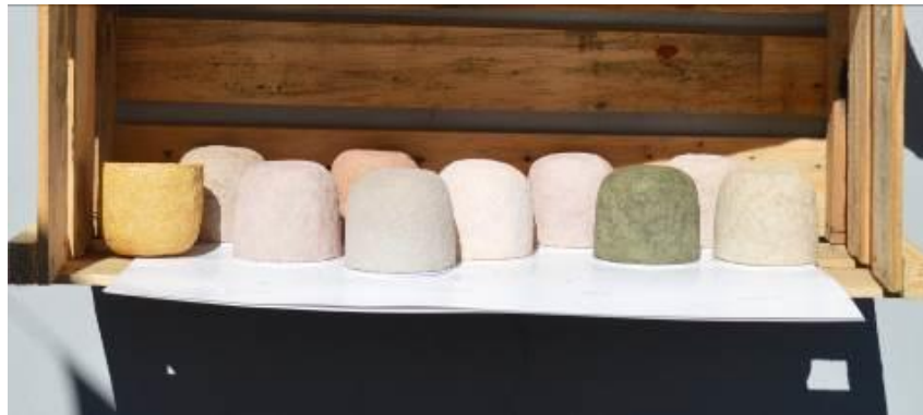
Figura 11 – Potes de papel machê secos.

Interessante notar que os corantes canela e macela conferiram odor agradável aos potes. Em relação à secagem, acredita-se que um dos fatores que facilitou o surgimento de bolor foi a utilização da cola caseira, feita com farinha de trigo, além da alta umidade do ar.