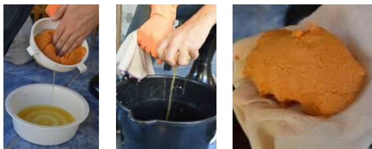
Figura 6 – Retirada do excesso de água da massa de papel.

A massa de papel que estava de molho foi colocada em uma peneira para, novamente, retirar o excesso de água. Em seguida, a massa obtida foi torcida com um pano, para retirar a água restante (Figura 6).