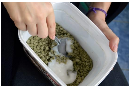
Figura 7 – Massa de papel esfarelada sendo misturada com o grude.