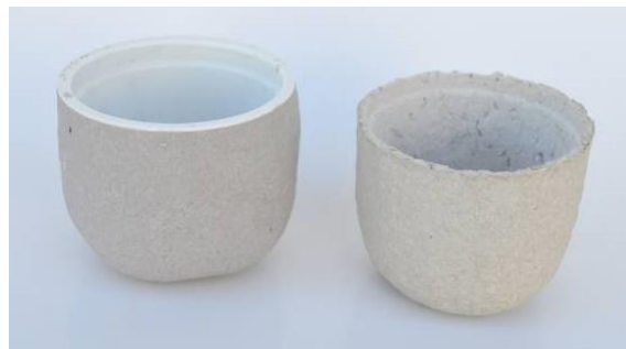
Tingimento com beterraba.