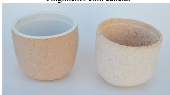
Tingimento com colorau.