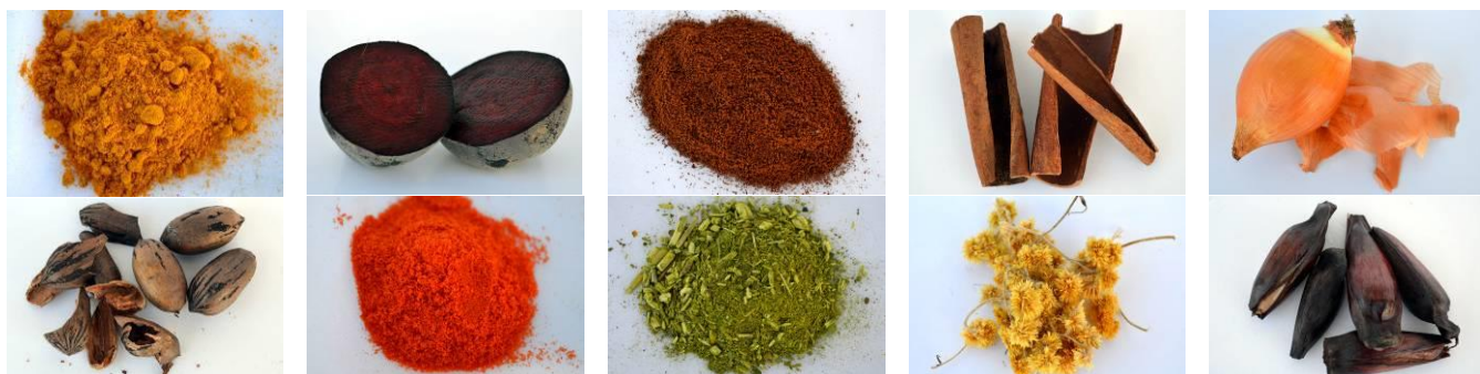
Figura 3 – Corantes naturais utilizados nos testes: açafraão, beterraba, café, canela, casca de cebola, casca de nozes, colorau, erva-mate, macela e pinhão.

Não utilizou-se nenhum tipo de moagem ou esmagamento para potencializar o corante; eles foram utilizados na forma na qual foram encontrados, de maneira que pudessem ser aproveitados posteriormente como alimento.