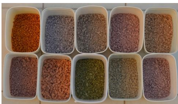
Figura 8 – Papel tingido, já peneirado e torcido.

Obtendo-se uma massa homogênea, é possível iniciar a modelagem na forma. O processo consiste em espalhar a massa na superfície da forma, atentando-se para que não haja nenhum espaço sem preenchimento. Para conferir o aspecto liso, utilizou-se uma colher e adicionou-se um pouco de grude para facilitar o espalhar da massa (Figura 8).