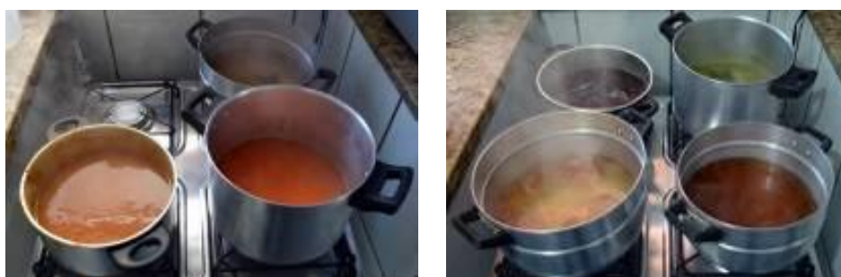
Figura 4 – Cozimento dos corantes.

O procedimento a seguir foi realizado com todos os corantes no mesmo dia. Misturaram-se os corantes desejados com 1,5l de água fria e levou-se ao fogo. Aqueceu-se a mistura até ferver, e deixou-se fervendo por 30 minutos, a exceção do pinhão e beterraba, que permaneceram mais tempo no fogo até que estivessem cozidos (Figura 4).