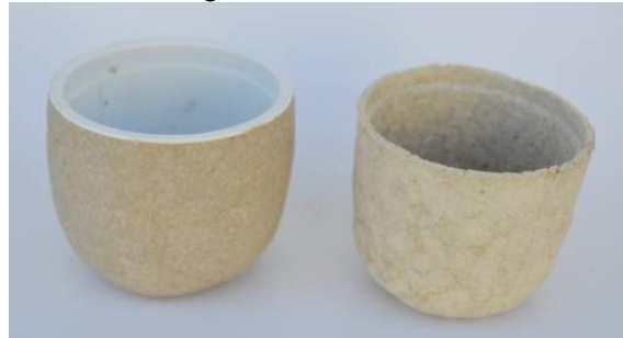
Tingimento com macela.