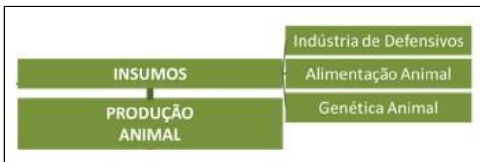
Figura 2 - Cadeia presente no Estudo

Ferreira e Padula (2002) sugeriram três configurações de coordenação a partir de três elos diferentes da cadeia de suprimentos, as quais foram verificadas e extraídas do mercado da carne riograndense. A primeira a partir do elo varejista, a segunda a partir do elo industrial e a terceira a partir do elo da produção primária. Para este estudo, será analisada uma díade inserida nesta cadeia de suprimentos, envolvendo os produtores de insumos e os produtores de carne de corte. A cadeia presente nesse estudo foi abordada conforme a figura abaixo: