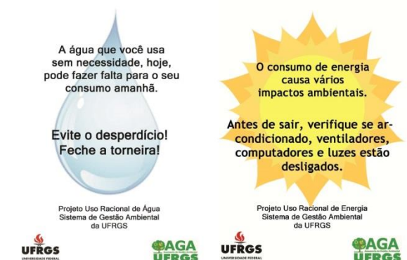
Figura 9 – Cartazes de estímulo à conscientização e ao uso racional de água e energia.

Internamente à Gráfica, estão presentes em locais estratégicos cartazes lembrando sobre o consumo consciente de água e luz, desenvolvidos pela Assessoria de Gestão Ambiental (AGA) da UFRGS. Lembretes como “Antes de sair, verifique se todas as lâmpadas encontram-se desligadas.”, “Antes de sair, verifique se ar-condicionado, ventilador, computadores e luzes estão desligados”, “A água que você desperdiça hoje pode fazer falta pra seu consumo amanhã. Evite o desperdício, feche a torneira” estão distribuídos em todos os setores (Figura 9).