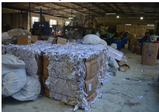
Fardos de papel branco já triturado e vista geral do galpão