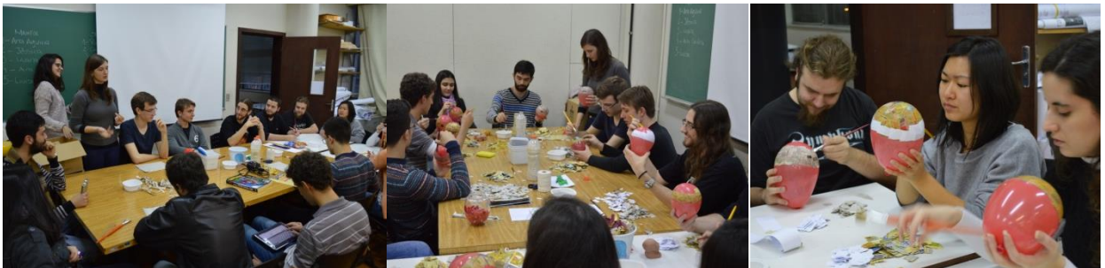
Figura 5– Oficina “Modelando objetos com a técnica de papietagem”, oferecida aos acadêmicos dos cursos de Design de Produto e Design Visual, em junho de 2013.