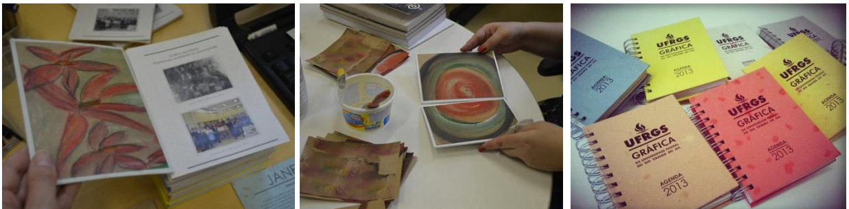
Figura 12 - Agendas desenvolvidas pela Gráfica da UFRGS, mostrando a parte interna (à esquerda e imagem central) e externa do produto.