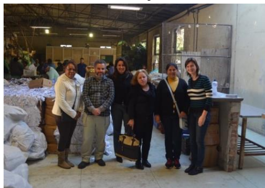
Colaboradores da Gráfica da UFRGS e coordenadores da ATUT