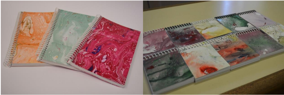
Figura 13 – Blocos confeccionados com aparas de papel da Gráfica da UFRGS.