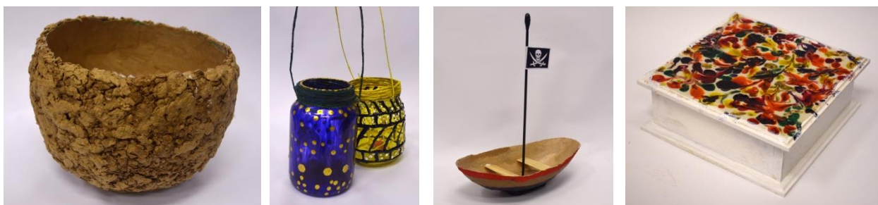
Figura 8 - Trabalhos realizados pelos adolescentes cumprindo medida socioeducativa.

No Núcleo, são atendidos atualmente 6 jovens, entre 14 e 17 anos, que realizam atividades de pintura, modelagem de papel machê e papietagem, desenvolvendo também senso estético e artístico. Abaixo (Figura 8), alguns trabalhos realizados pelos jovens no primeiro semestre de 2013, sob orientação da funcionária Maria da Glória dos Santos.