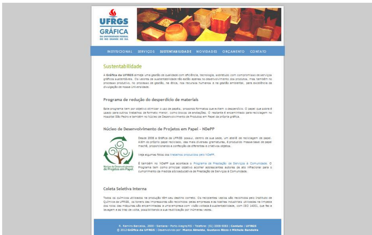
Figura 11 – Página da Gráfica da UFRGS, onde na aba Sustentabilidade são divulgadas algumas práticas socioambientais.

A educação ambiental também é abordada na fanpage da Gráfica em redes sociais. Dicas de reciclagem, redução do consumo e reutilização são postadas e têm bastante retorno positivo por parte daqueles que acompanham a página. No próprio site da Gráfica ( www.ufrgs.br/graficaufrgs ), na aba Sustentabilidade, são divulgadas algumas das ações socioambientais praticadas (Figura 11).