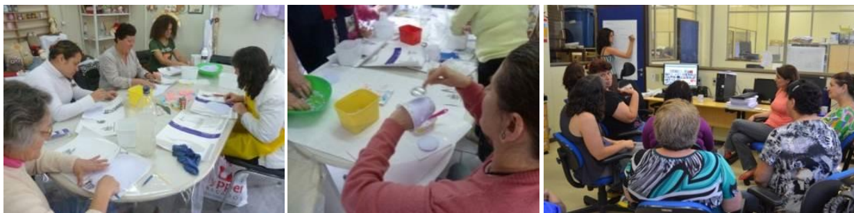
Figura 6 – Atividades realizadas durante os encontros: experimentações na massa de papel, modelagem de artefatos e conversa sobre as expectativas.