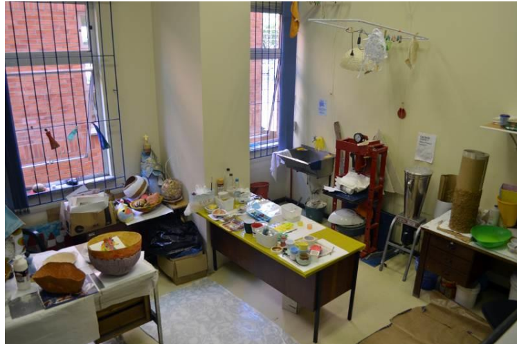
Figura 4 – Dependências do NDePP, situado internamente à Gráfica da UFRGS.

Algumas das pesquisas e ações desenvolvidas pelo Núcleo são citadas abaixo.