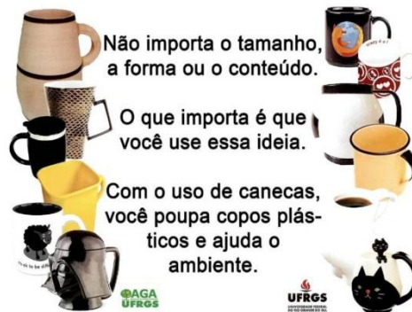
Figura 10 - Cartaz de estímulo ao uso de canecas.

Cada colaborador ganhou uma caneca de presente, com a marca da Gráfica, e é estimulado a usá-la, ou trazer a sua de casa. Para as visitas, há xícaras sobressalentes. Existem cartazes difundindo essa prática, também criados pela AGA: “Não importa o tamanho, a forma ou o conteúdo. O que importa é que você use essa ideia. Com o uso de canecas, você poupa copos plásticos e ajuda o ambiente” (Figura 10).