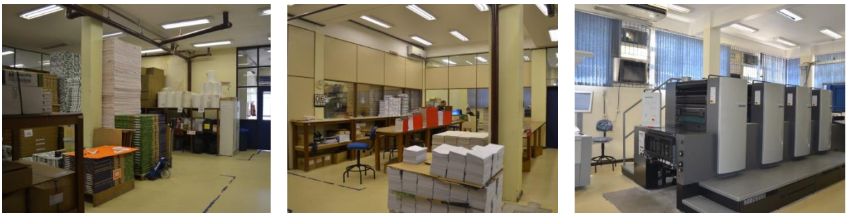
Figura 1 – Alguns dos setores da Gráfica da UFRGS.

Atualmente, a Gráfica está organizada nos seguintes departamentos: Direção; Administração e Financeiro; Recepção e Expedição; Produção e Orçamento; Setor de Compras; Núcleo de Desenvolvimento de Projetos em Papel; Núcleo de Criação, Editoração e Revisão e Web; Pré-Impressão; Impressão Digital; Impressão Off-set e Acabamento. Na imagem abaixo (Figura 1) podem ser vistos o Setor de Compras, Acabamento e Impressão Off-set .