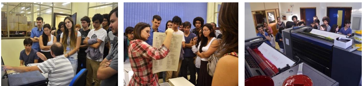
Figura 14– Visita dos alunos do curso de Design da UFRGS, na disciplina Processos de Produção Gráfica, realizada em abril de 2013.

Algumas das visitas realizadas recentemente por discentes da UFRGS foram: curso de Artes Visuais, em junho de 2013; curso de Design, na disciplina Design, Identidade Cultural e Artesanato, também realizada em junho de 2013; curso de Design, na disciplina Processos de Produção Gráfica, realizada em abril de 2013 (Figura 14); e a mesma disciplina, com outra turma, em outubro de 2012.