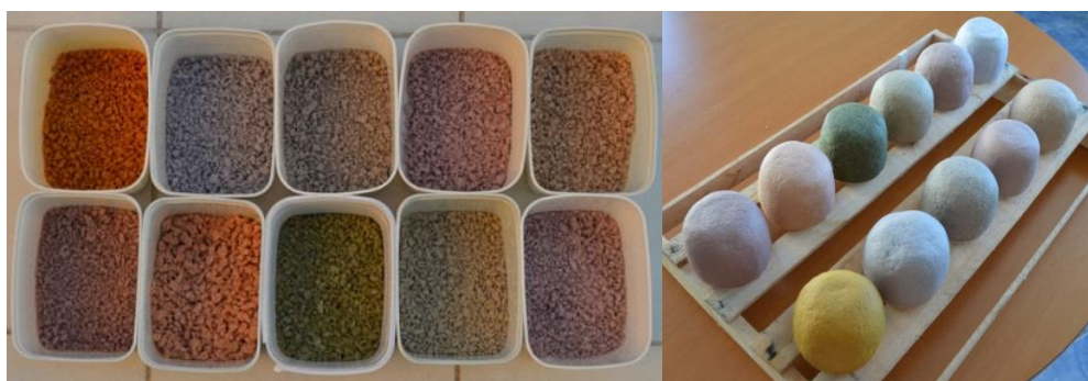
Figura 7 – Papel tingido, já peneirado e torcido (esquerda) e potes modelados, no processo de secagem (direita).

Após este processo, o papel foi peneirado, torcido, misturado com cola caseira e modelado sobre uma forma plástica. O estudo ainda está na etapa de análise dos resultados, mas concluiu-se com as experimentações que o papel responde bem aos corantes naturais, sendo uma possibilidade a mais de experimentações no material, podendo-se evitar assim o uso de tintas e corantes tóxicos.