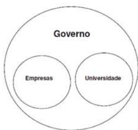
Figura 1. Modelo estático de relações entre universidade-empresa-governo. Fonte: adaptado de Etzkowitz; Leydesdorff (2000) .