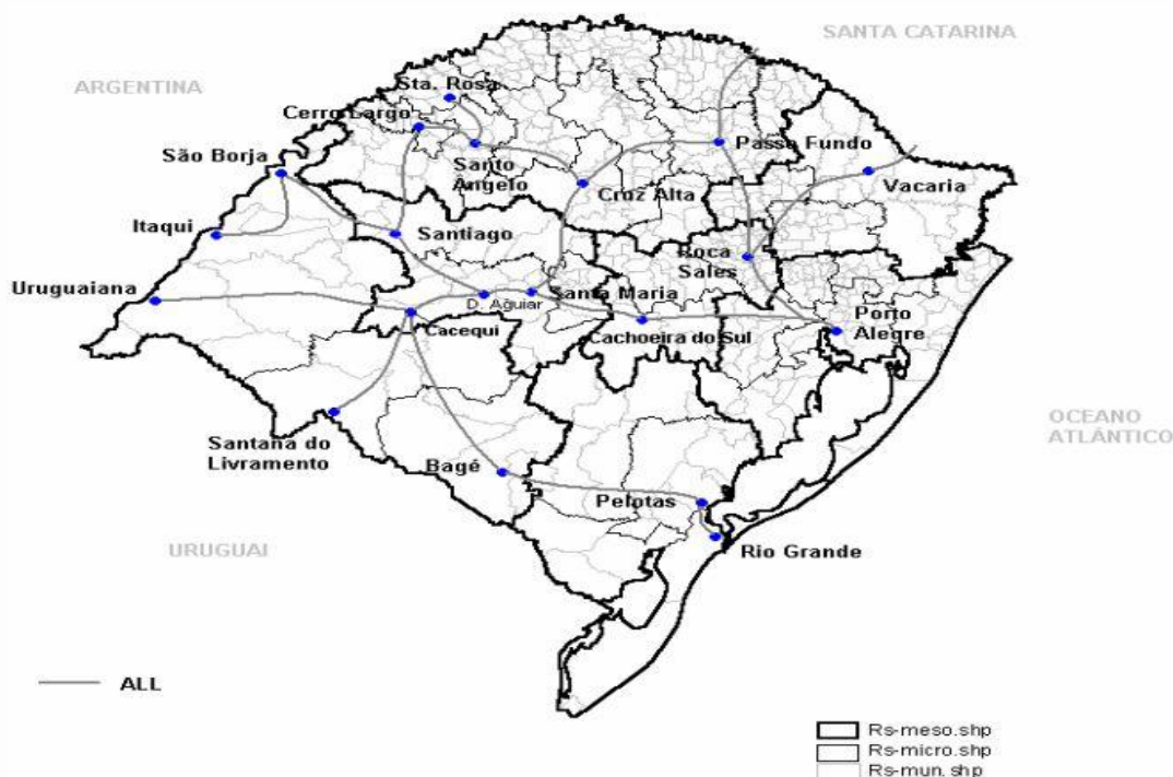
Figura 1 – Infra-estrutura ferroviária no Estado do Rio Grande do Sul